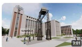
Teren dawnej Elektrociepłowni 'Garbary' - wizja miasta (wersja... 497 wyświetleń · 3 lata temu