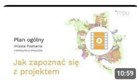
Projekt Planu ogólnego miasta Poznania - jak się zapoznać z... 843 wyświetlenia · 1 miesiąc temu