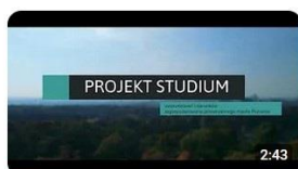
Projekt nowego Studium Poznania 1,2 tys. wyświetleń · 2 lata temu