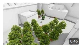
Projekt mpzp 'Stare Miasto' przestrzeń publiczną w rejonie... 512 wyświetleń · 3 lata temu