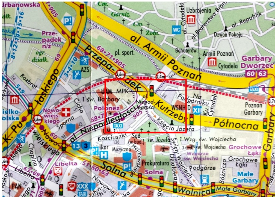
Plan Poznania, Wyd. Grupa Cartomedia 2013/2014 r.

Głosowanie: w sprawie pozytywnego zaopiniowania projektu uchwały (PU 593/20) w sprawie zniesienia nazwy placu Niepodległości