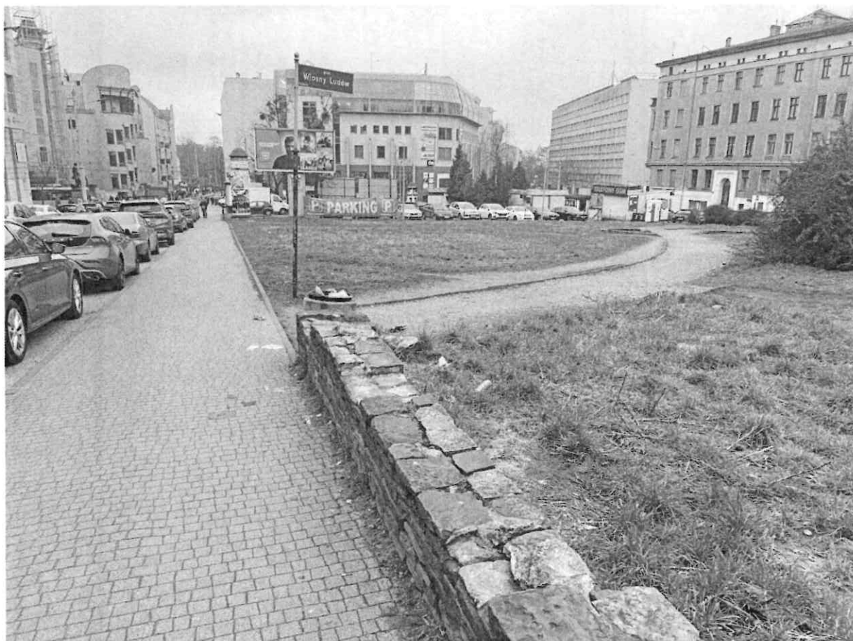
Skwer w centrum miasta