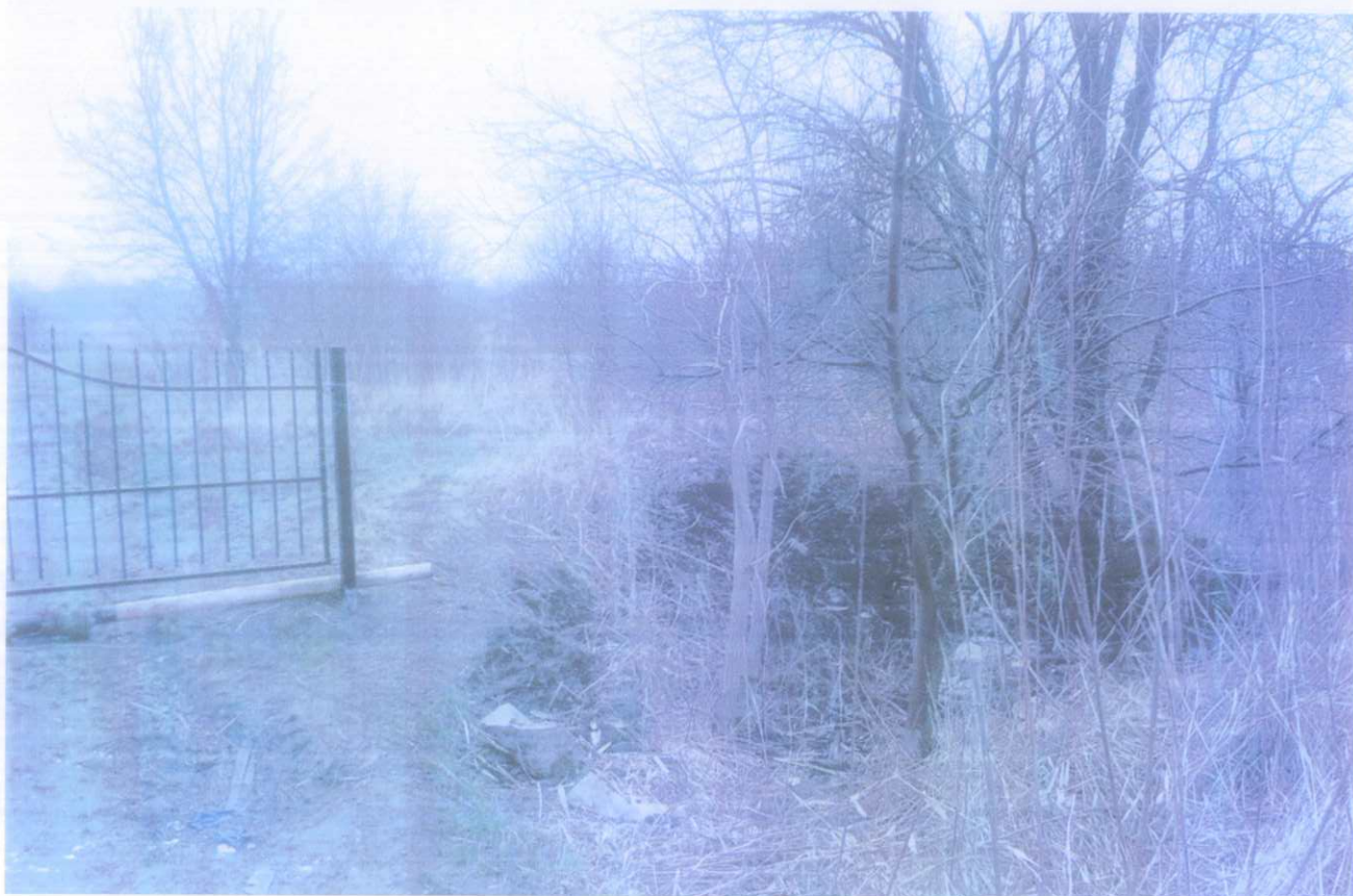
Przestrzeń, którą należy uporządkować w celu udrożnienia przejścia