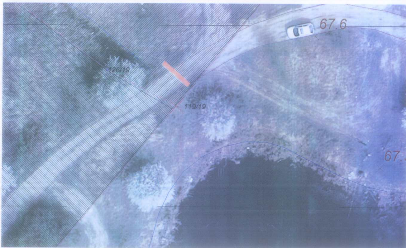
Miejsce przegrodzenia drogi przez prywatnego właściciela