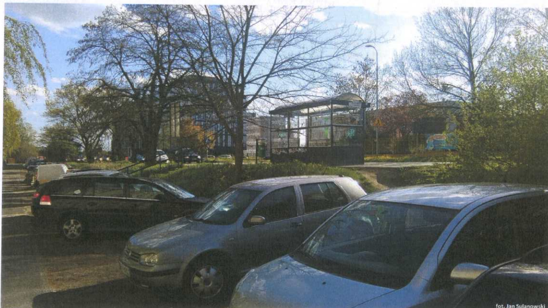
Fotografia nr 1