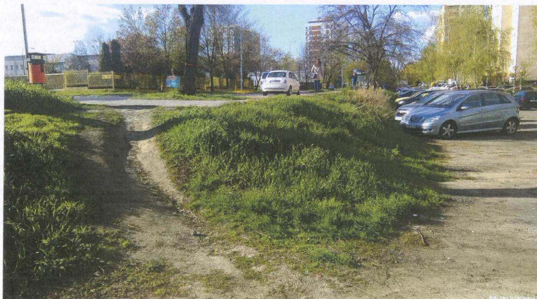
Fotografia nr 3