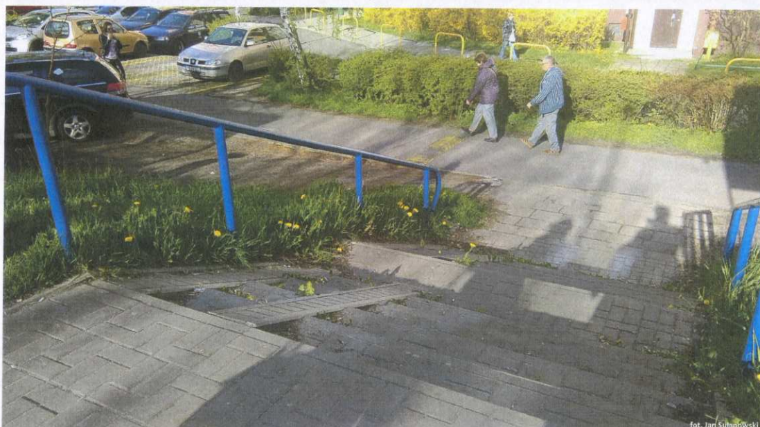
Fotografia nr 2