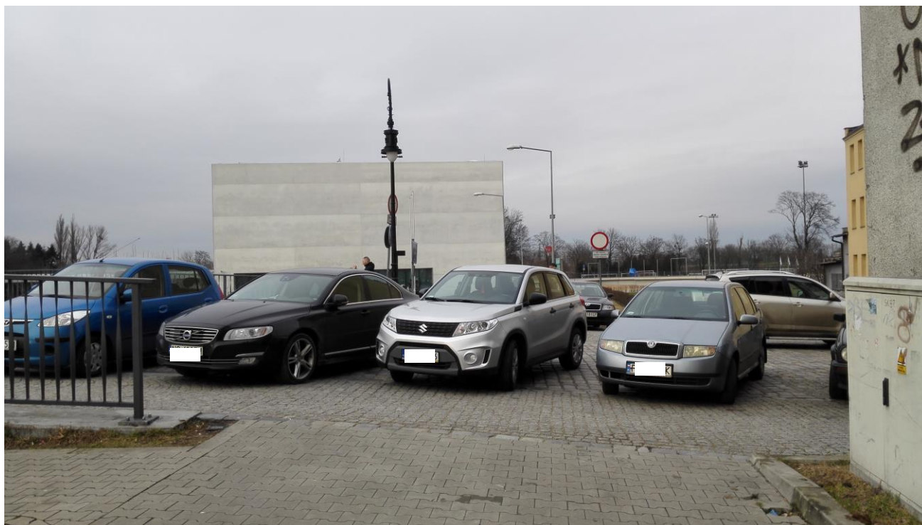
samochody parkujące w ciągu Wartostrady