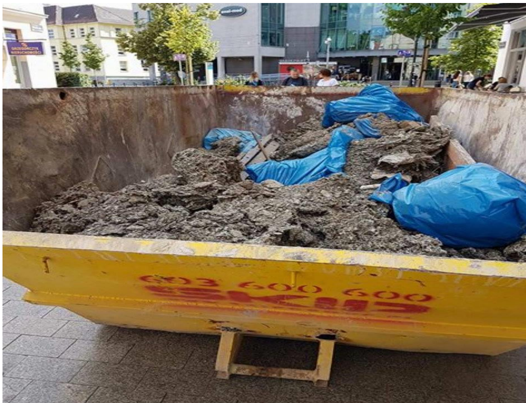
Zdjęcie numer 1 - kontener z odpadami z budynku przy ulicy Wrocławskiej 20

nie była prawidłowo zabezpieczona, wobec czego przez długi czas przebywały tam duże skupiska gołębi lub innych ptaków, które zanieczyszczały budynek, przeszkadzały mieszkańcom i powodowały znaczne zagrożenie epidemiologiczne dla zdrowia ludzi.