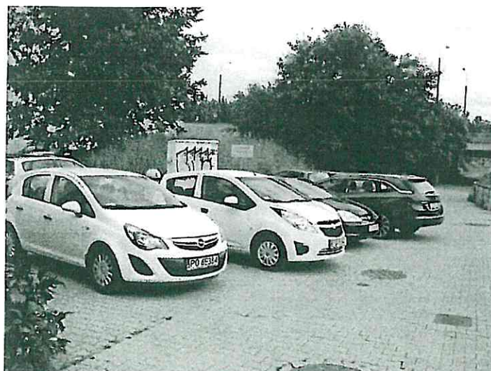
Samochody parkujące na Wartostradzie

W przypadku pozytywnej opinii Rady Osiedla, ZDM skonsultuje jeszcze sposób wygradzenia ze spółką Aquanet, z uwagi na znajdującą się w tym miejscu infrastrukturę.