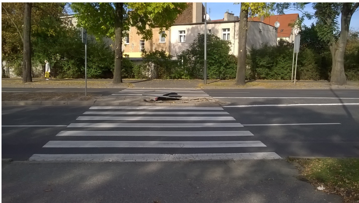
Fot. 1. Sytuacja z dnia 6.10.2018 r.