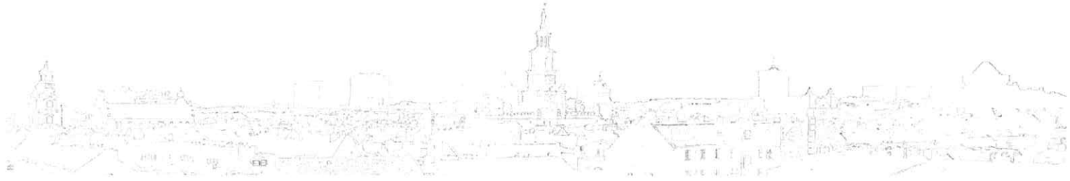
Wycinek ortofotomapy z roku 2014