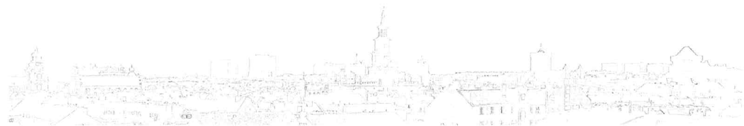
Wycinek ortofotomapy z roku 2018