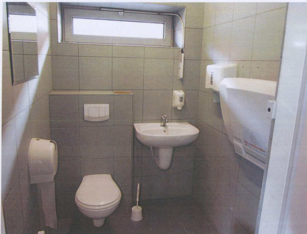
Toaleta – Górczyn