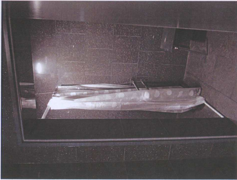
Toaleta – Ostrów Tumski - prysznic