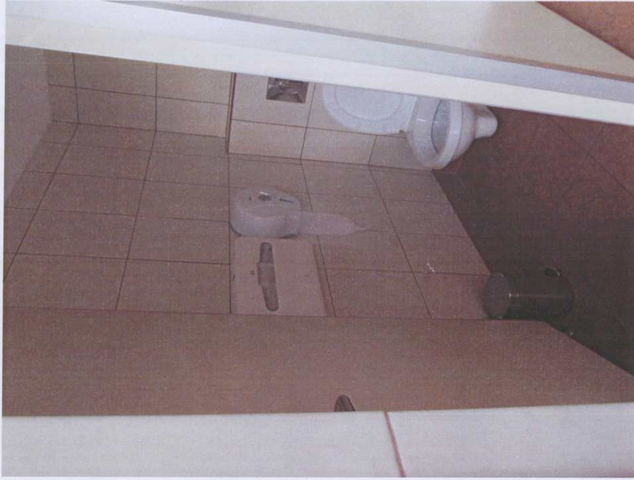
Toaleta – Ogrody