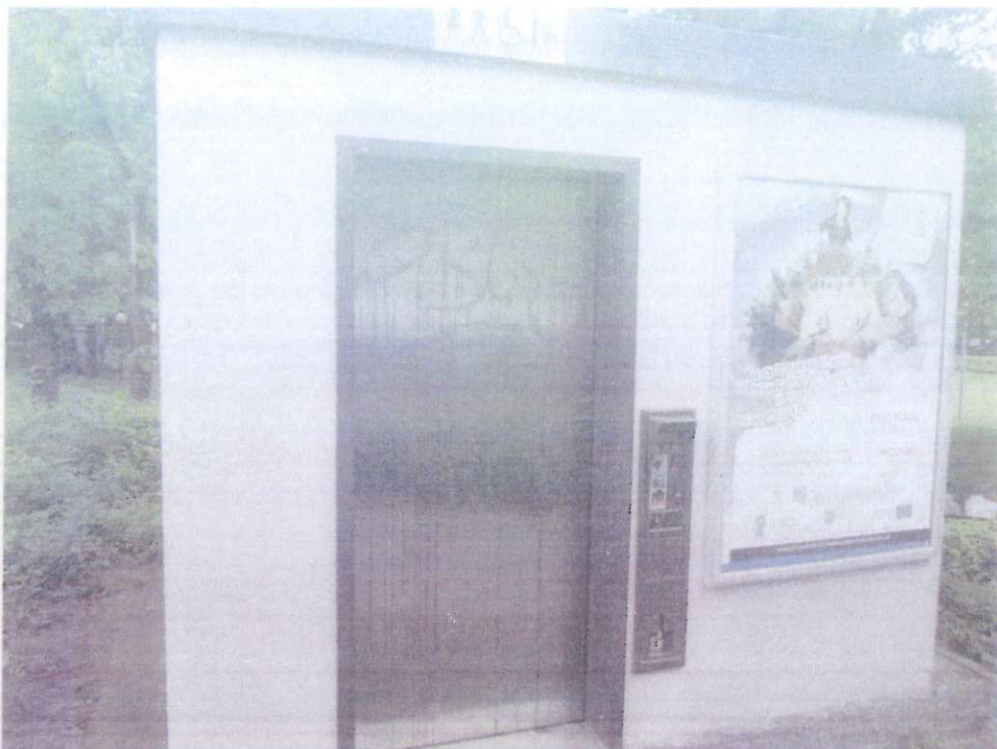
Graffiti na drzwiach toalety automatycznej na ul. Wieniawskiego