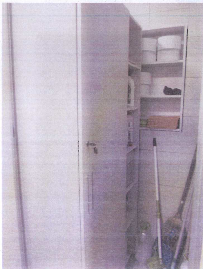
Pomieszczenie gospodarcze w toalecie przy ul. Berwińskiego