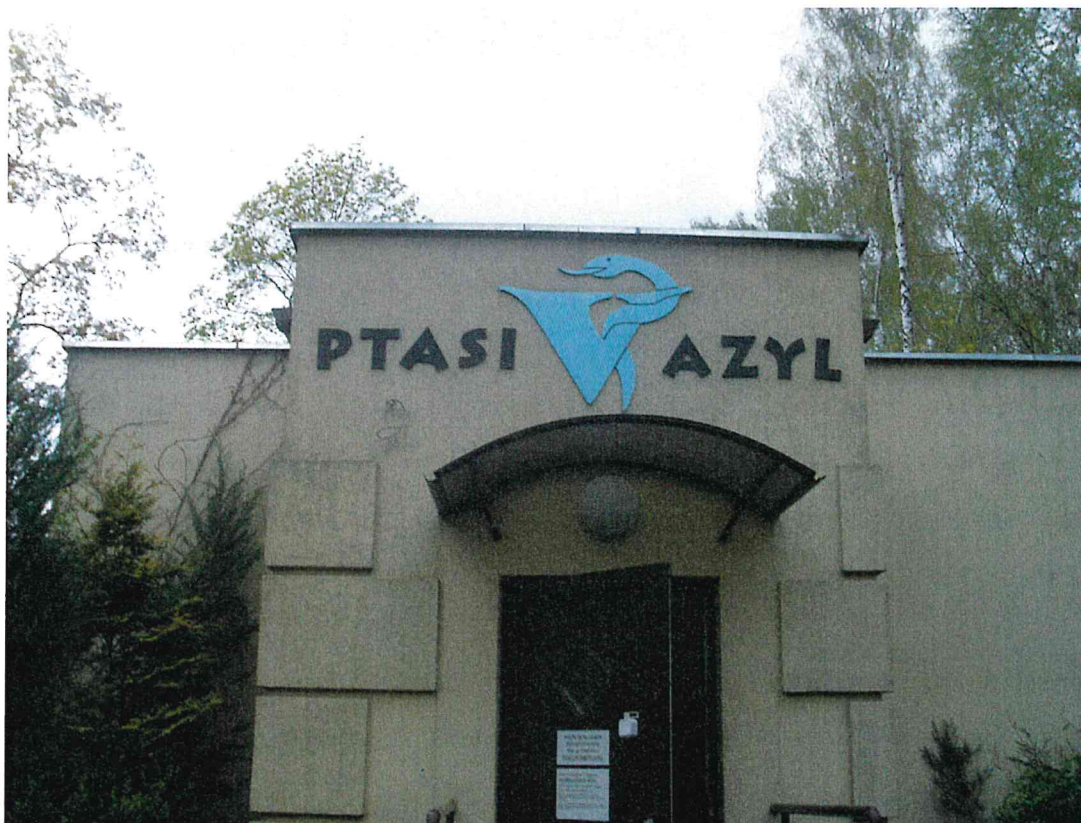
Fot. 2. Główne wejście do Ośrodku – maj 2016 r.