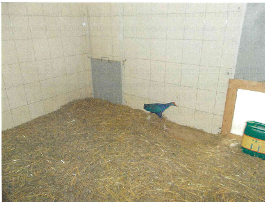
Fot. 1 Woliera F- ptak po zabiegu