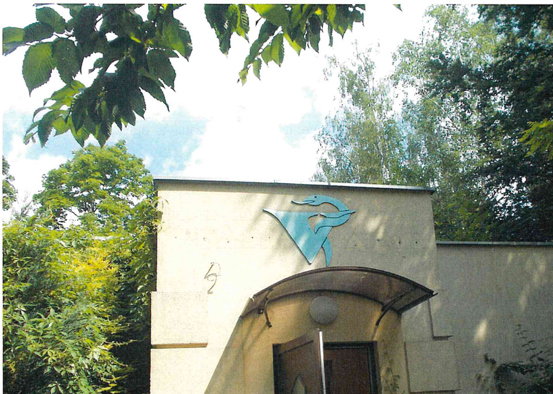
Fot. 3. Wejście do budynku od strony ul. Krańcowej – obecnie