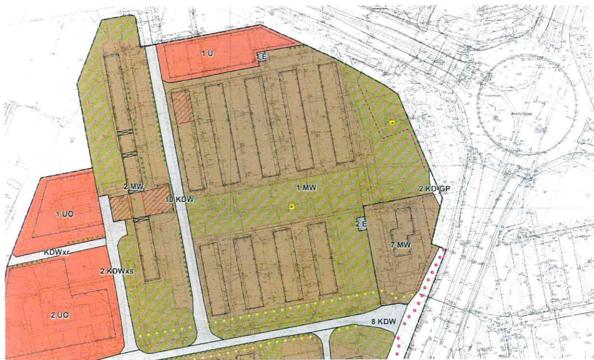
Rys. nr 1 Fragment rysunku mpzp „Osiedle Piastowskie” w Poznaniu – stan prac wrzesień 2014r.

Na obecnym etapie prac projektowych zieleniec przy skrzyżowaniu ul. L. Zamenhofa i ul. Bolesława Krzywoustego został wyłączony z zabudowy i wyznaczony jako strefa zieleni urządzonej towarzyszącej zabudowie wielorodzinnej w ramach terenu oznaczonego na rysunku planu symbolem 1MW (rys. nr 1).