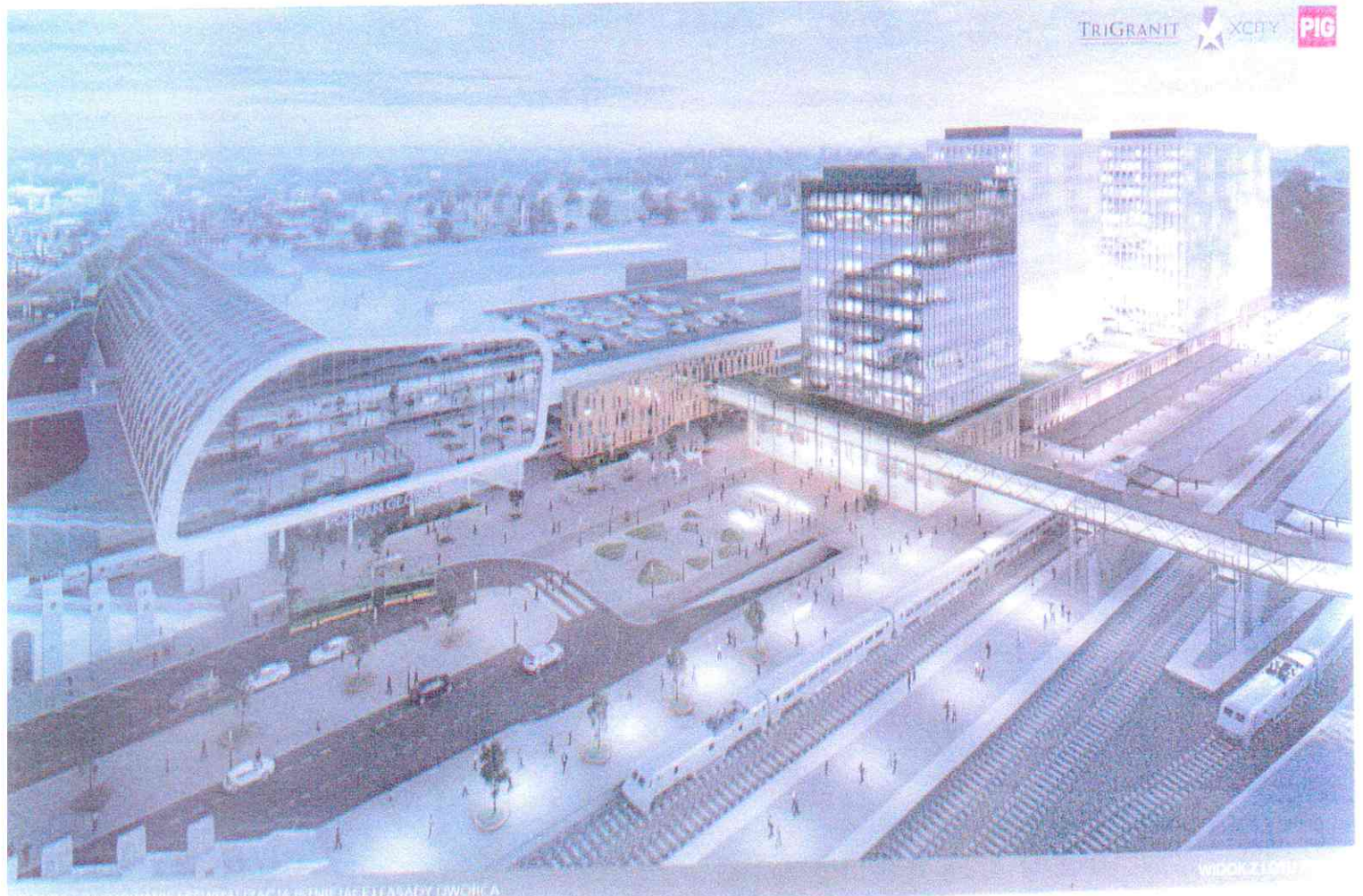
WARIANT 1 - ZACZYNANIE I REWITALIZACJA ISTNIEJĄCEJ STANOWISKA DWORCA