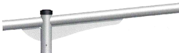
WYSIĘGNIK – kolorystyka RAL 7042