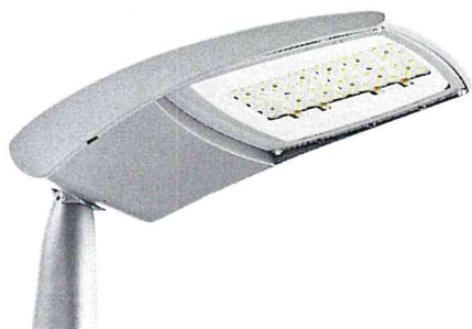
OPRAWA ŚWIETLNA – kolorystyka RAL 7042